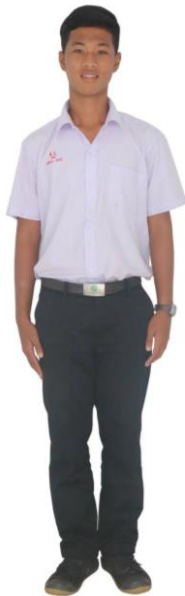
ชุดนักเรียนชาย ม.1-5