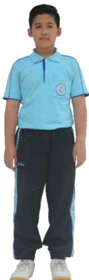
ชุดพละ นร.ชาย อ.1-ป.6