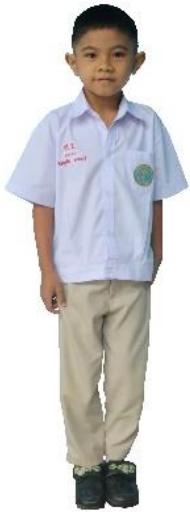
ชุดนักเรียนชาย อ.1 – ป.6