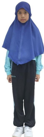
ชุดพละ นร.หญิง อ.1-ป.6