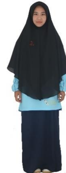
ชุดพละนักเรียนหญิง ม.1-6