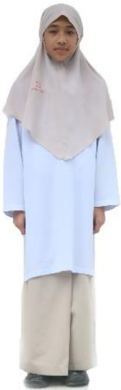
ชุดนักเรียนหญิง ป.3-ป.6