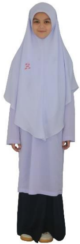
ชุดนักเรียนหญิง ม.1-3