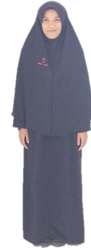
ชุดนักเรียนหญิง ม.6