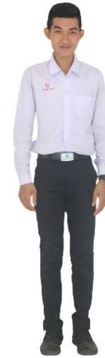
ชุดนักเรียนชาย ม.6