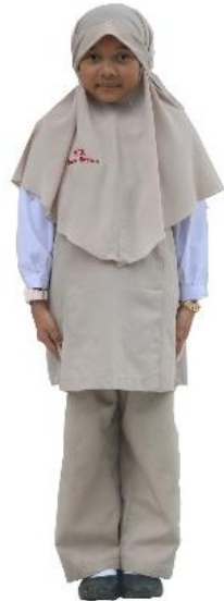
ชุดนักเรียนหญิง อ.1 – ป.3