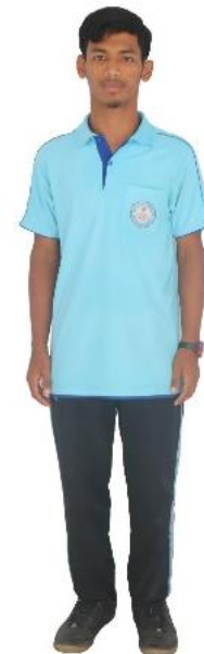
ชุดพละนักเรียนชาย ม.1-6