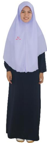
ชุดนักเรียนหญิง ม.4-5